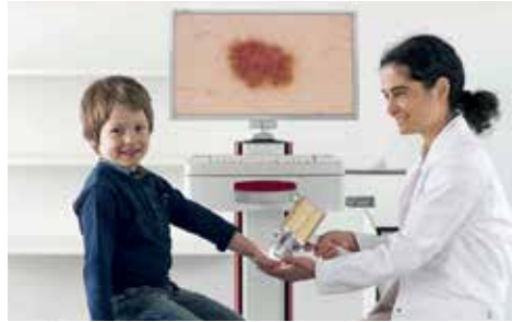
فحص سرطانات الجلد