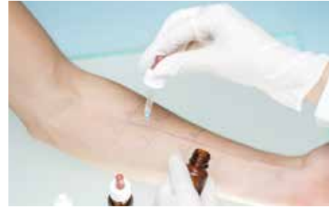
فحص حساسية الجلد