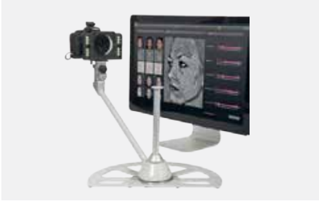
فحص الجلد ثلاثي الأبعاد