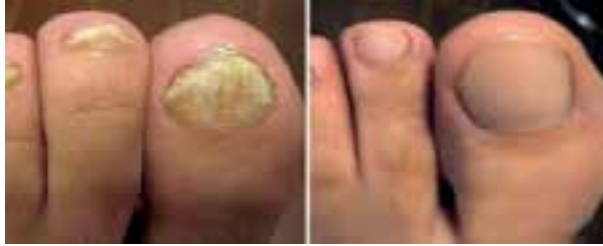
علاج التهابات الأظافر الناجمة عن الفطريات