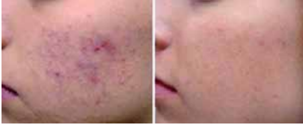
علاج حب الشباب