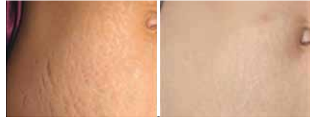
علاج تشققات الجلد الناجمة عن الحمل وتغيير الوزن المفاجيء