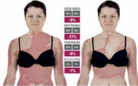
قياس شدة الصدفية