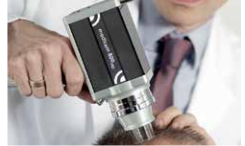
فحص دورة حياة الشعر (جهاز الترايكوجرام)