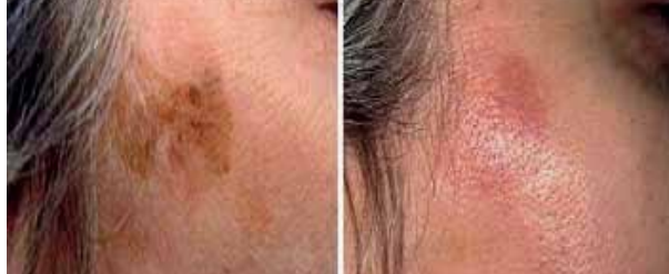
علاج التصبغات الجلدية