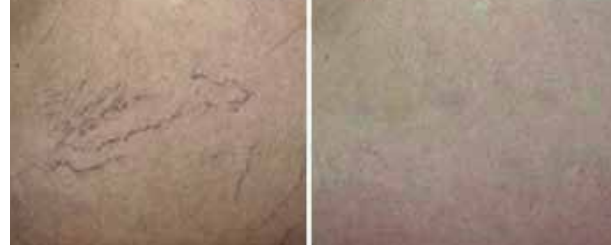
علاج الأوعية الدموية والدوالي